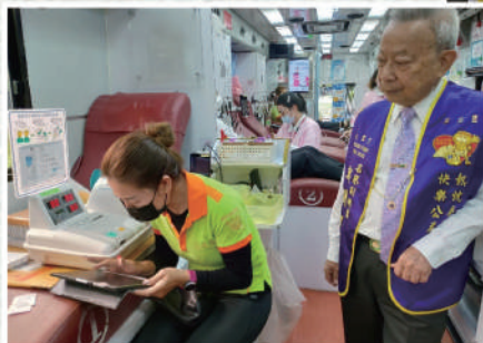
● 鄭董事長關懷志工同仁