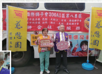
● 鄭董事長夫婦鼓勵捐血活力人生