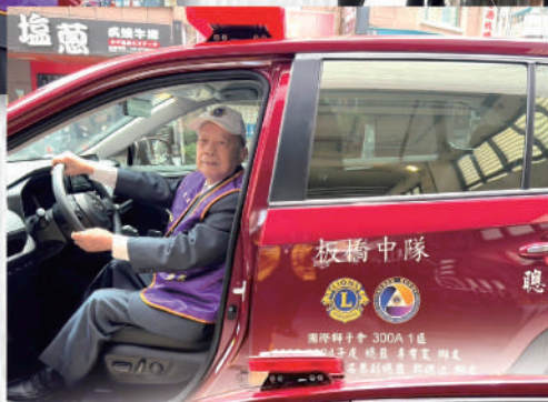
●鄭董事長親身體驗勘查車